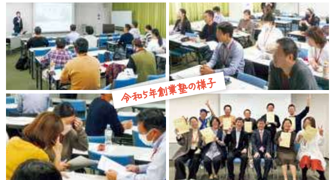
※プライバシー保護のため一部画像を加工しております

他の参加者も様々な業種の方で、お互い話を聞いてもらいながらアドバイスやアイデアを出し合い有意義な時間でした。今もその時のご縁で応援しあっています。学んだことを行動に移す事で、道は開けます!