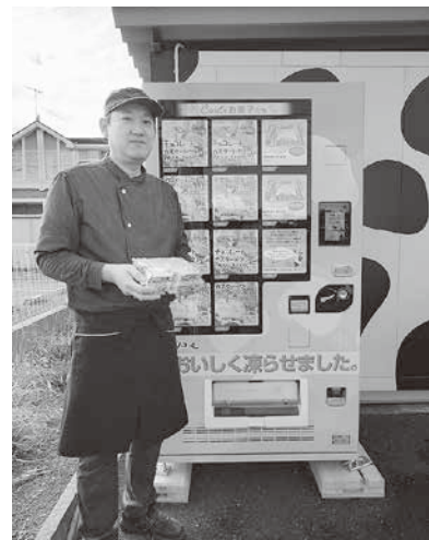
新たに設置した冷凍自動販売機

【今後の展望】 新たに導入した設備を活用し、冷凍商品のラインナップの拡充や、ふるさと納税への出品等を通して販路開拓を図ります。