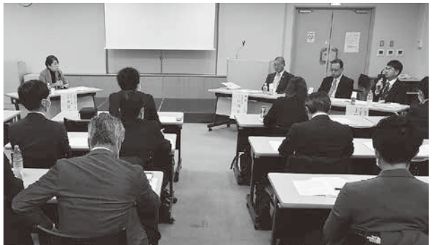
様々な意見が出されたパネルディスカッション

また、全国各地の商店街視察を重ね集客を高めるイベントの在り方を模索し、年間来場者五十万人を超える商店街