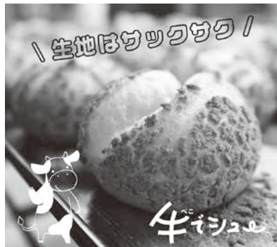
大人気の牛でシュー

住 所：遠田郡美里町牛飼字新西原256-2 T E L：0229-33-3550 H P：https://mikawade.com/