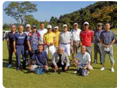
スタート前のひとコマ

去る、七月二十八日(金)利府ゴルフ倶楽部において、支部会員の融和を図ることを目的に利府支部会員親睦ゴルフ大会を開催しました。