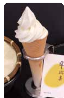
豆乳ソフトクリーム

素材である豆乳を使って如何に愛されるソフトクリームを作るかという試行錯誤を繰り返し、令和五年四月末に販売を開始したところ、一口目から豆乳の味が広がる等好評を博し、これまで来店の少なかった十代〜二十代の若年層に口コミが広がり来店が増加。既存の豆腐製品の販売にも繋がりが、客単価も上昇する等手応えがありました。