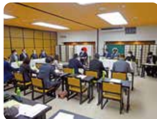
熱心な審議が行われました

通常総会終了後には、「健康寿命を延ばすための健康管理について」と題し、松島町健康長寿課健康づくり班の栄養士と保健師のお二方にご講演いただきました。簡単に行える運動や食事のとり方について学ぶことができ、大変有意義な講習会となりました。