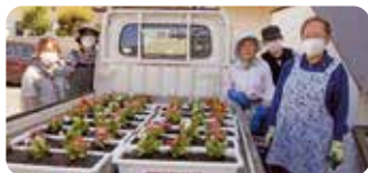
花いっぱい運動(利府地区)

六月十九日(月)、二十日(火)、女性部員十六名が各地区で集まり、地域の環境づくりを目的に花いっぱい運動を実施しました。