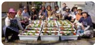
花いっぱい運動(松島地区)