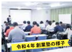
令和4年創業塾の様子