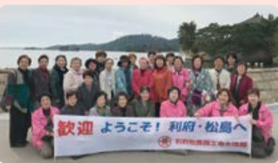
「おもてなし交流事業」