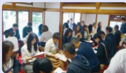
「ワクワクカップリングパーティーの様子」

利府梨まつりでは、「利府風お好み焼き」を販売、松島産業まつりでは「松島のりしんじょ汁」を販売し、地域に密着した女性部活動を展開しています。